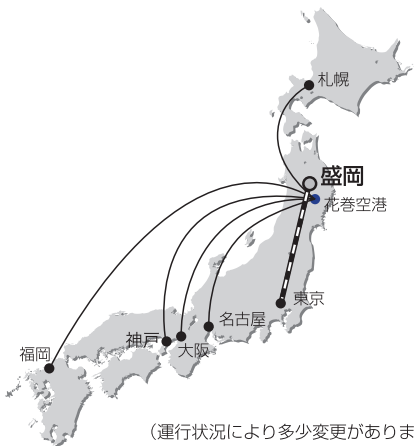
(運行状況により多少変更があります)